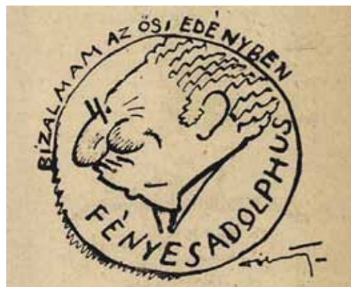
1. Pólya Tibor karikatúrája Fényes Adolfról, Színházi Élet, 1918. szeptember 8., 25.