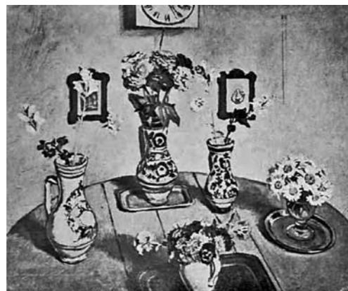
3. Fényes Adolf: Csendélet, 1912 lappang