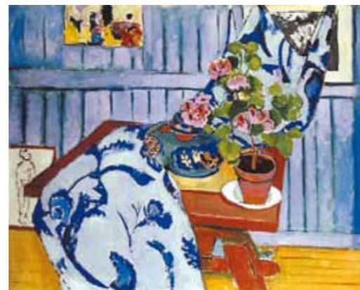
4. Henri Matisse: Csendélet rózsamuskátlival, 1910 Pinakothek der Moderne, München

Fényes Adolf 1912 őszén – több, mint öt év „hallgatást” követően – az Ernst Múzeumban mutatta be új festményeit, melyek tematikájában – enteriőrök és tájképek mellett – a csendéletek domináltak. Lázár Béla lényeglátó elemzése alapján Fényes a „magyar csendéletet” teremtette meg: új stílusában a felülnézeti perspektíva „naiv rálátását” hétköznapi, „naiv”