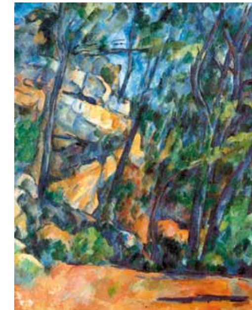
2. Paul Cézanne: Fák és sziklák a Château Noir parkjában, 1904 körül Museum Langmatt Sidney and Jenny Brown Foundation