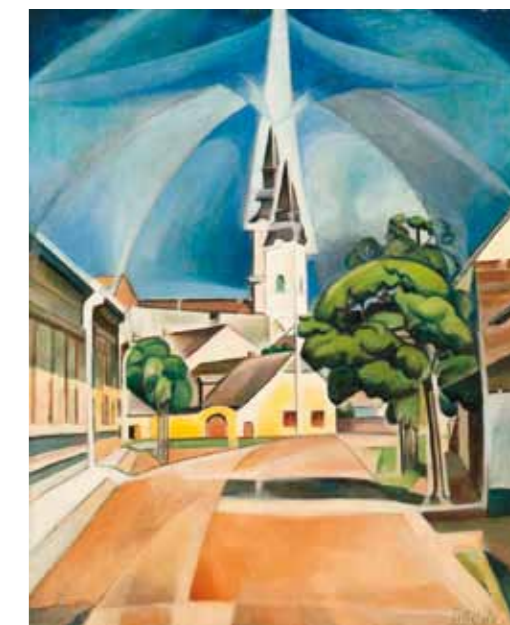
3. Kmetty János: Kecskemét, 1912 Magyar Nemzeti Galéria, Budapest