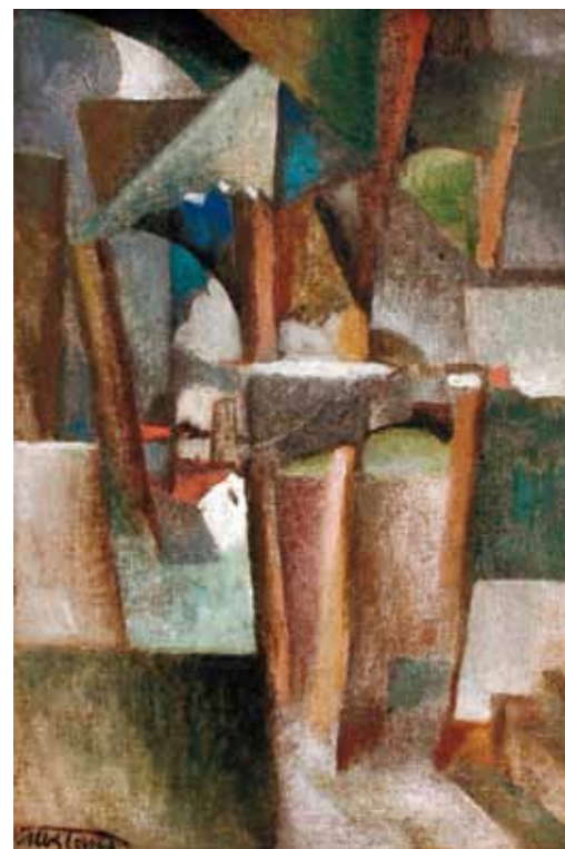
1. Albert Gleizes: Fák, 1910-1912 magántulajdon